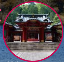
箱根神社 (公益社団法人 神奈川県観光協会)