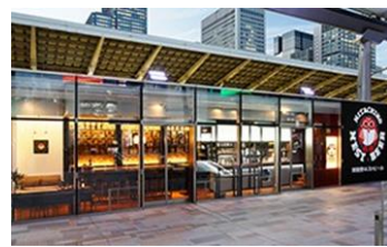
常陸野ブルーイング・ラボ Tokyo Station