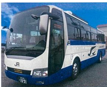
《運行車両・座席イメージ》